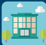
Conseil d'administration, bureau, équipe d'experts au siège de la fédération