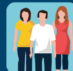
9 530 bénévoles