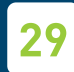
unions départementales ou interdépartementales